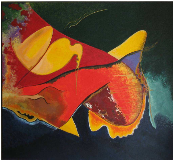
Composizione IV 1997 - Acrilici su tela - 70x70 cm